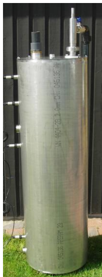
Z pompą dla filtrów ciśnieniowych (wydajność <15m 3 /godz)