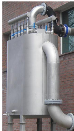
Bez pompy dla komór otwartych/filtrów otwartych (wydajność ≤200m 3 /godz)