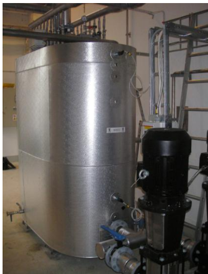
Z pompą dla filtrów ciśnieniowych (wydajność 100m 3 /godz)